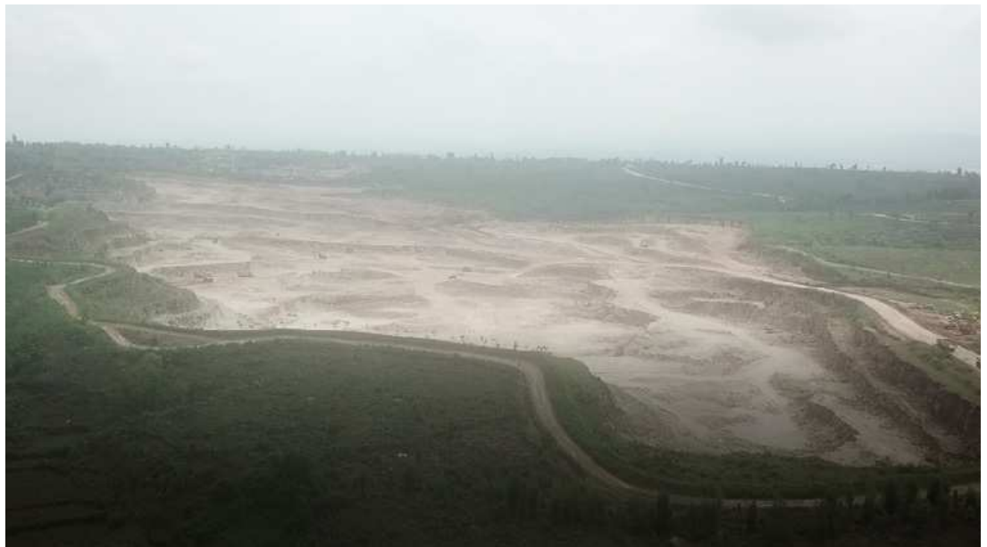
Foto: Lokasi Tambang PT Semen Indonesia, Rembang