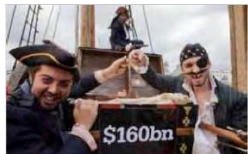
Foto dapat bermanfaat bilamana anda ingin menggunakan event eksternal untuk mempromosikan pesan anda. Contoh: Christian Aid ingin mengimbau pemimpin G20 untuk memerangi penghindaran pajak dengan menuntut perusahaan-perusahaan multinasional untuk mengungkapkan keuntungan dan pembayaran pajak mereka di tiap negara dimana mereka beroperasi. Untuk melakukan hal itu diorganisasikanlah satu kampanye peran di mana para aktifis berpakaian sebagai ‘perompak’.

Anda juga dapat menggunakan foto untuk menggambarkan peluncuran satu laporan pajak, jajak pendapat, atau berita apa pun yang berhubungan dengan pajak. Di samping gambar, anda dapat menyiapkan caption yang bagus untuk dibagikan kepada media, saat menyiapkan pemberitaan foto